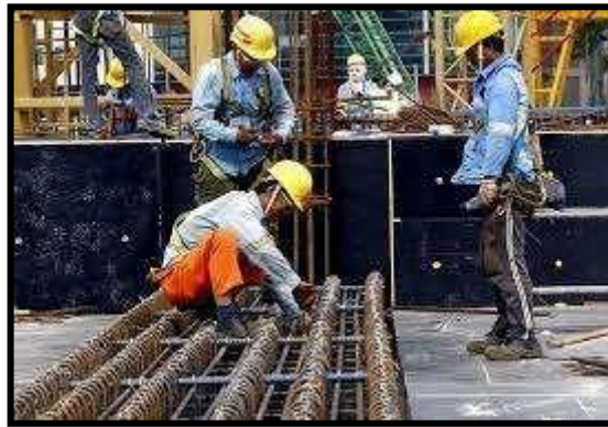
Gambar 2 : Pekerja binaan sedang bekerja

Pekerjaan merupakan satu kegiatan yang dilakukan oleh seseorang untuk mendapatkan sumber rezeki yang halal.