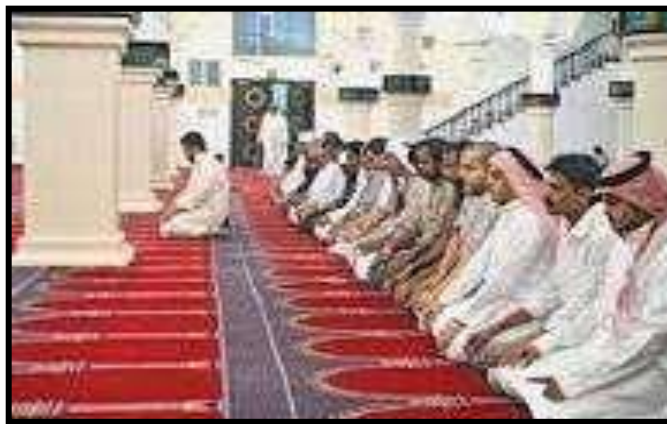
Gambar 1 : Contoh ibadah kepada Allah SWT

Gambar 1 di atas, menunjukkan contoh ibadah khusus fardhu ain yang menjadi kewajipan bagi setiap individu muslim.