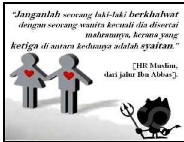
Gambar 3 : Hadis tentang peraturan bergaul dalam Islam