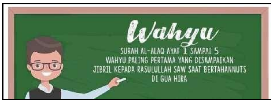
Gambar 4 : Wahyu pertama yang diturunkan